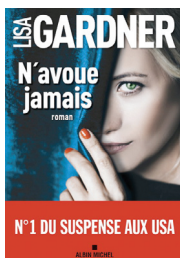
N'AVOUE JAMAIS Lisa Gardner