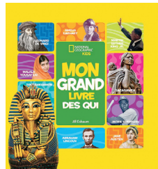
MON GRAND LIVRE DES QUI Jill Esbaum