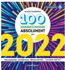
100 CHOSES À SAVOIR ABSOLUMENT EN 2022 Alain Mckenna