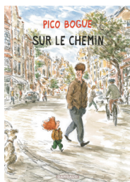
PICO BOGUE. 18. SUR LE CHEMIN D. Roques, Alexis Dormal