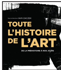
TOUTE L'HISTOIRE DE L'ART DE LA PRÉHISTOIRE À NOS JOURS